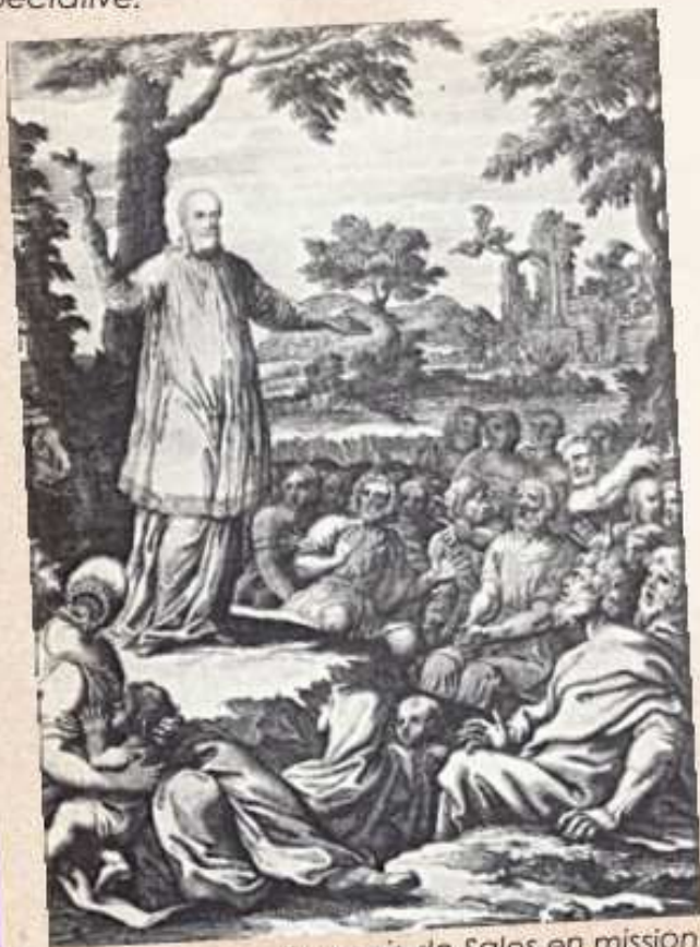
François de Sales en mission